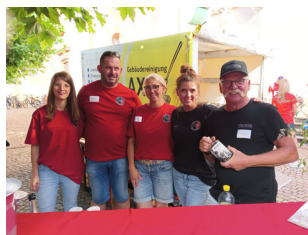
Das Team an der Cocktail-station