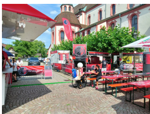
Der FC 08 präsentiert sich.