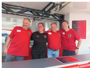
Das Team im Bierbrunnen vor dem großen Ansturm.