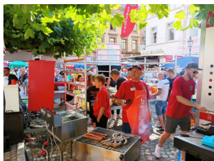
Hochbetrieb an der Food-station.