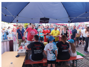
Lange Schlangen vor den Bonkassen.